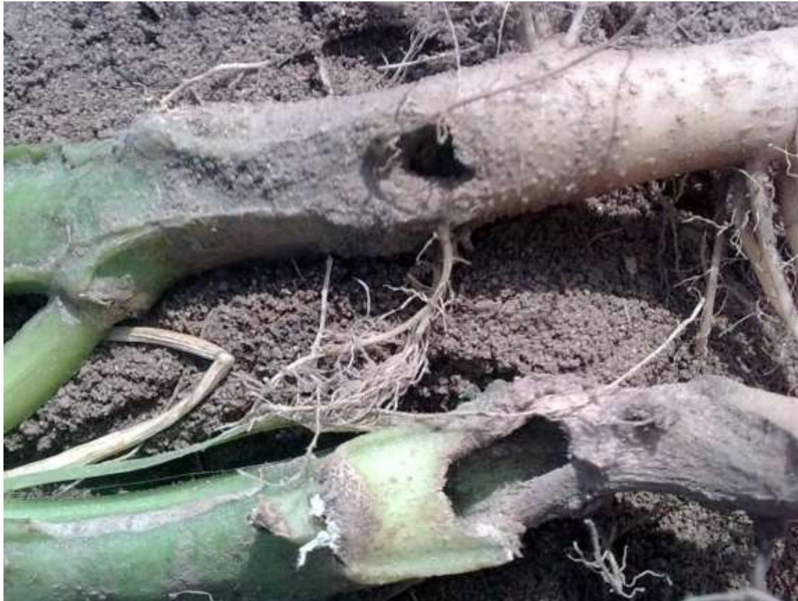
Стебли сорта Жуковский ранний, поврежденные гусеницей озимой совки