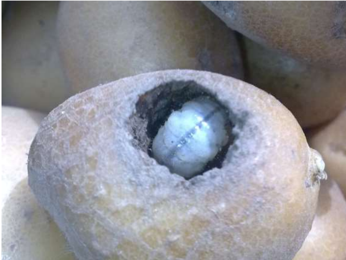
Клубень сорта Удача, поврежденный личинкой майского жука